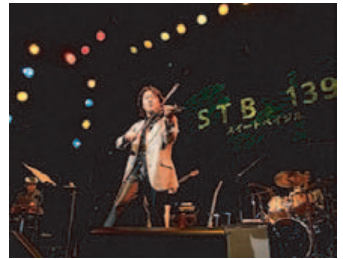
六本木STB 139スイートベイジルにて