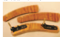
肩当(円) ¥11,025 楓

オリジナルハードケース 2011年から新たにデザイン性能が変わりました。 ハードケース(円) ¥29,400